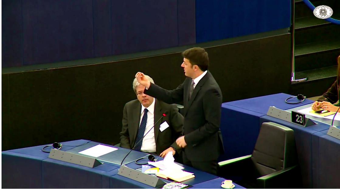
Figure 1 – Gesture n° 12. in the PRG's dictionary