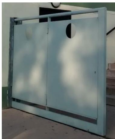
Nice (France), October 2014