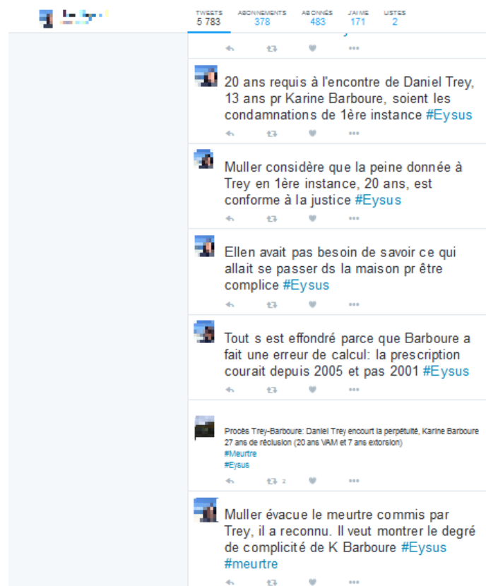
Figure 1 - Capture d'écran du compte d'un live-tweeter de procès