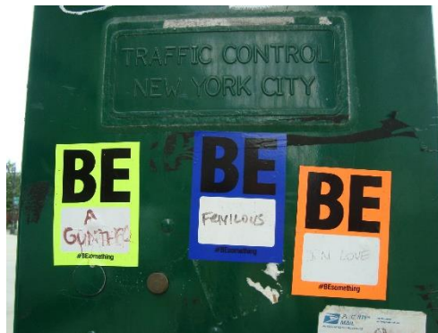
Untitled, stickers on traffic light, ca 10x15, New York (USA), 2015