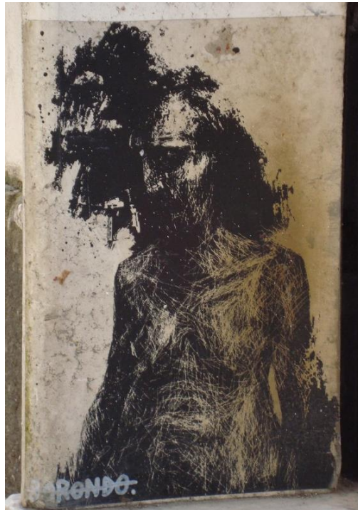
Untitled, paint on wall, ca 20x30, Rome (Italy), 2014