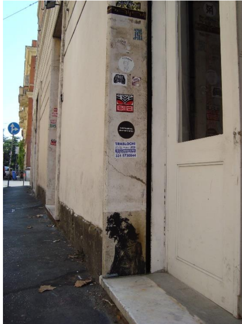
Untitled, paint on wall, ca 20x30, Rome (Italy), 2014