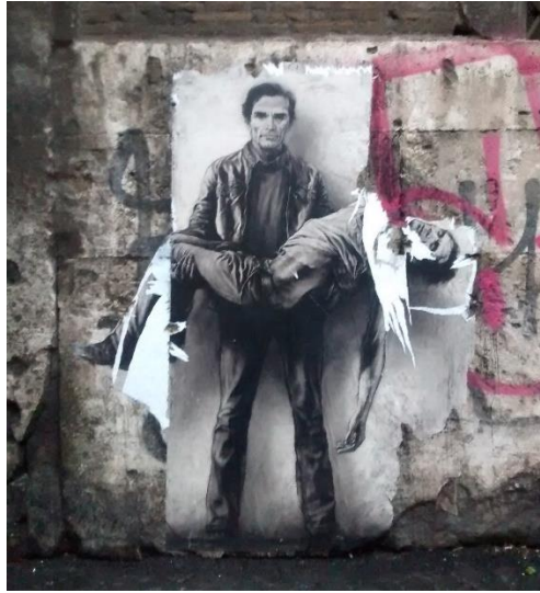
Pasolini 40 ans après by Ernest Pignon-Ernest, paper on wall, ca 170x150, Rome (Italy), 2015