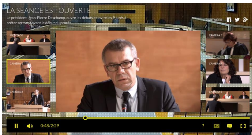
Figure 6 - Websérie Intime conviction