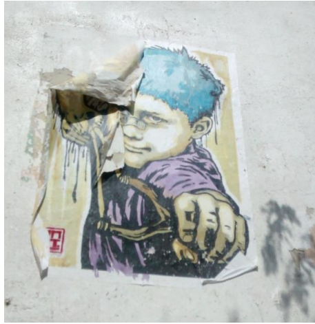
Untitled, paper glued on wall, ca 50x40, Marseille (France), 2014

Many artists deliberately use very fragile tools such as chalk (like Philippe Baudelocque or David Zinn) or newsprint (like Ernest Pignon-Ernest). This choice is intrinsically poetic: the artwork changes with time, like all living things. The Italian artist Nemo's uses paint for bones and newsprint for skin and flesh: when the fragile paper has gone, the skeleton appears.