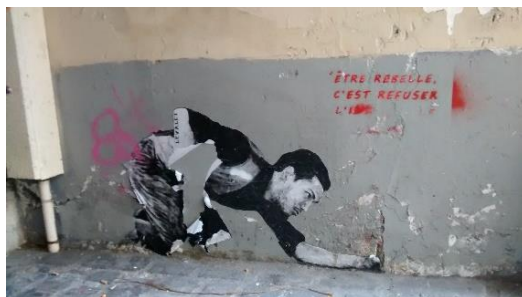
Untitled, paper on wall, ca 130x80, Paris (France), April 2014