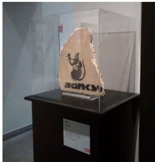
Radar Rat, stencil on wall, 45.5x38x3.5, Exhibition Street Art Banksy & co. L'art allo stato urbano, Bologna (Italy) 2016

Last but surely not least, an incalculable number of works have mainly turned into various images of themselves, «Internet Art» (Glaser, 2015), through specialized and not specialized websites and social networks.