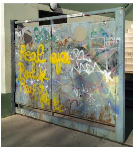
Real eyes Realise Real lies, spray on door, ca 90x120, Nice (France), February 2014

Some are “cleaned up” because situated on sensitive props, such as the entrance door of a University, symbol of the institution itself (fig. 4 and 4 bis).