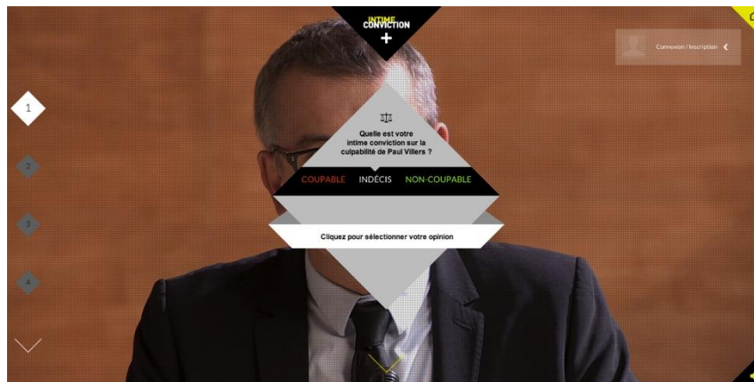
Figure 7 - L'élaboration de l'intime conviction