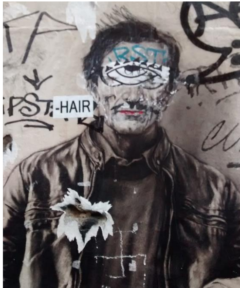
Pasolini 40 ans après by Ernest Pignon-Ernest, paper on wall, ca 170x150, Rome (Italy), 2015, detail

Furthermore, as a result of the artification (Heinich & Shapiro, 2012) of a significant part of Graffiti and Street Art, several pieces have become pieces of Urban Art, when protected by a plastic sheet in the street (like that of Miss Van, fig. 9), or Contemporary Urban Art, when removed from their natural site and exhibited in a museum or any art institution (like Banksy's Radar Rat in Bologna exhibition in 2016, fig. 10).