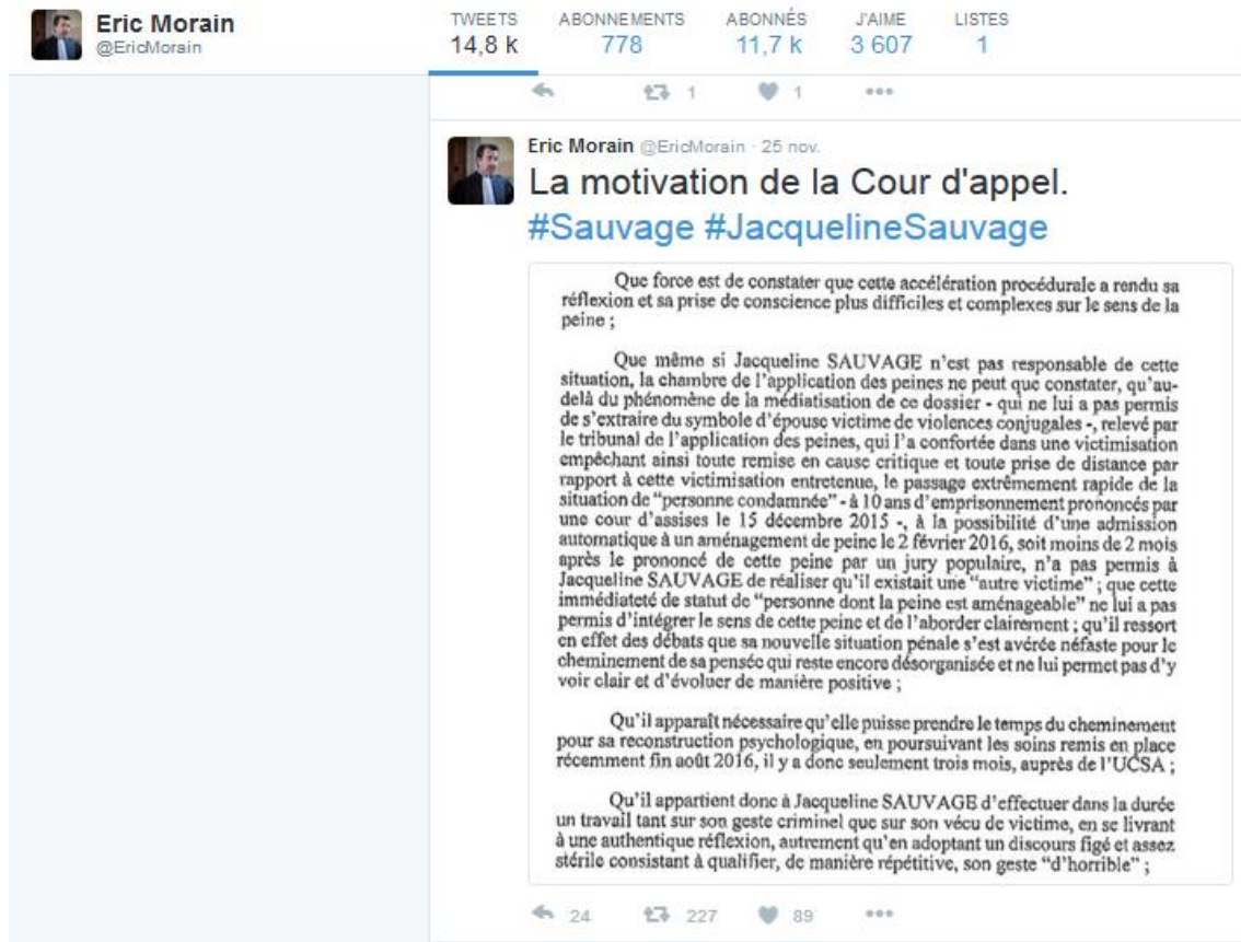
Figure 3 - La reproduction de la motivation de la Cour d’assises d’appel en tweet