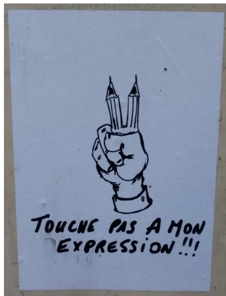
Touche pas à mon expression !!! paper glued on wall, 21x30, Nice (France), 2015 1