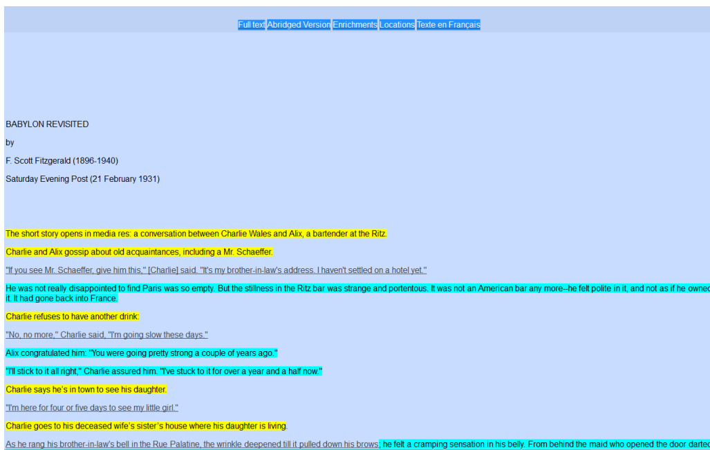
Figure 1 - Color-coded abridged version of the story

The screenshot of our eZB (figure 1), shows the following 5 tabulations: Full text, Abridged Version, Enrichments, Locations, Texte en Français.