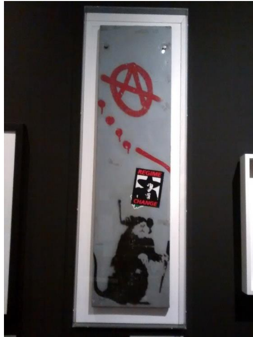
Anarchy Rat, spray on metal, 166x27.5, Exhibition Street Art Banksy & co. L'art allo stato urbano, Bologna (Italy), 2016