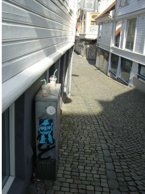
Untitled, stencil on sticker, ca 20x12, Stavanger (Norway), 2015