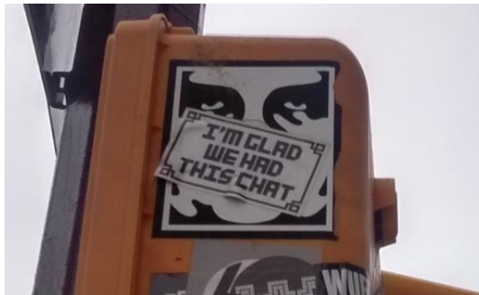
Untitled, stickers on traffic light, ca 20x20, New York (USA), 2015