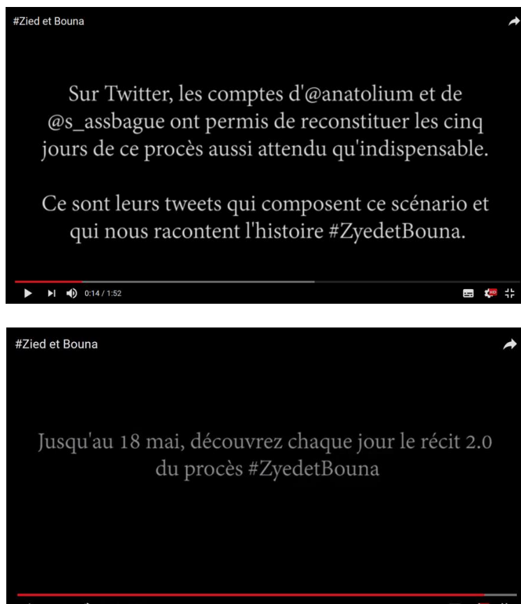
Figure 5 - Captures d'écran du film #zyedetbouna, le procès 2.0