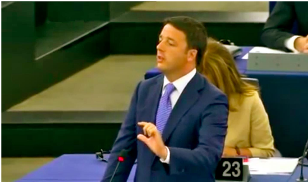
Figure 2 – Gesture n° 21. in the PRG’s dictionary