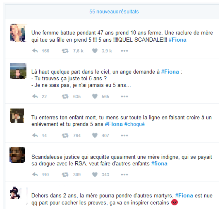
Figure 4 - #Fiona, le 25 novembre 2016, après le prononcé du verdict acquittant Cecile Bourgeon des coups mortels portés à sa fille Fiona