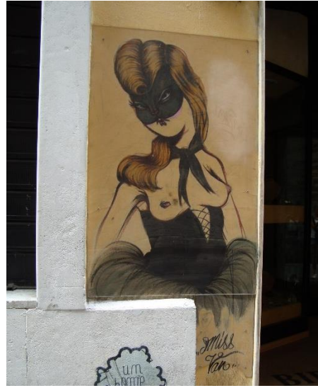
Untitled, paint on wall and plexiglass, ca 110x90, Rome (Italy), 2014