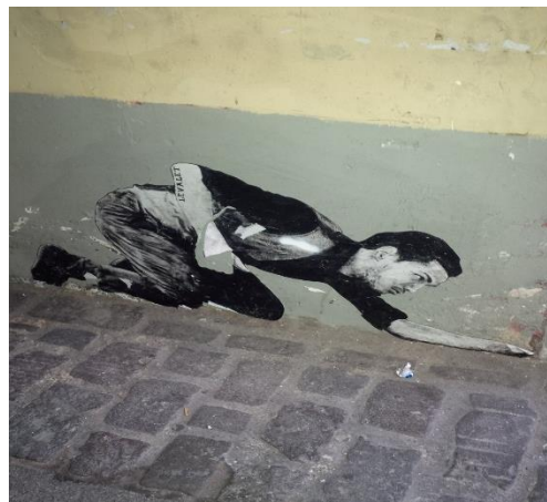
Untitled, paper on wall, ca 130x80, Paris (France), December 2013