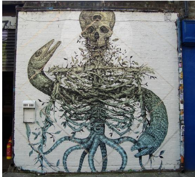
Untitled, paint on wall, ca 300x280, London (UK), 2014