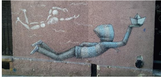
Untitled by Jérôme Mesnager & Julien Seth Malland, stencil and spray on wall, ca 200x150, Paris (France), 2013