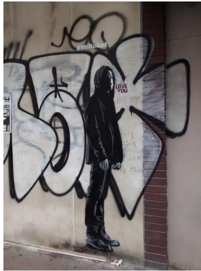
Untitled, stencil on wall, ca 150x40, New York (USA), 2015