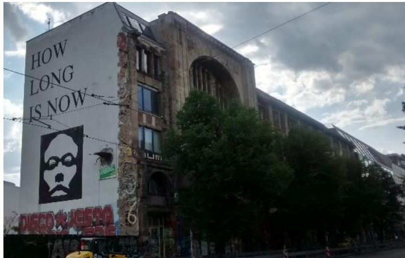
Untitled, paint on wall, ca 1000x500, Berlin (Germany), 2014

Moreover, Street Art works often represent self-portraits, which fight against death and oblivion: «Se peindre, c'est affirmer une présence hic et nunc [...]. Présent pour être recon- nu toujours par la postérité. Hic et nunc et semper » –painting oneself is stating a presence hic et nunc , here, now, and forever- (Bonafoux, 2004, p. 24, 28). Graffiti Writing and Street Art are full of self-portraits, either with tags (that are signatures), hoodies (alter egos of Graffiti and Street Artists, like on fig. 15), or assertions of presence like the famous «Kilroy was here» and its countless imitators.