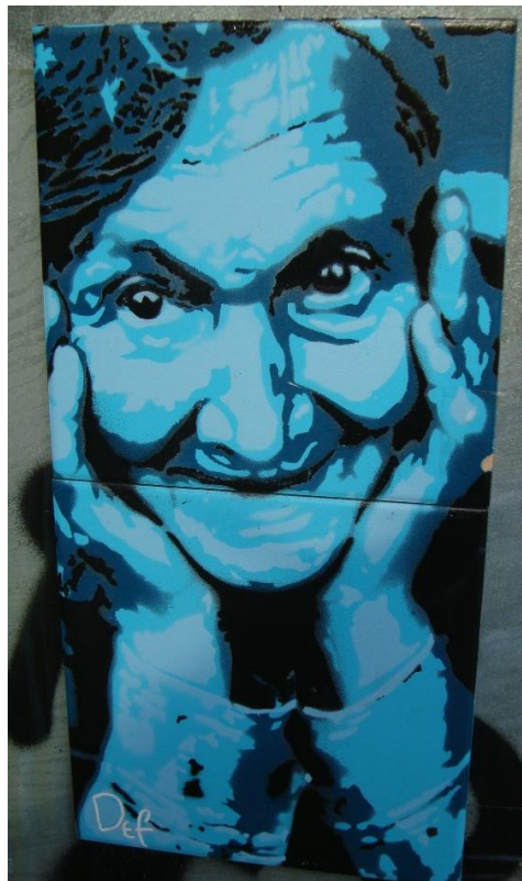
Untitled, stencil on sticker, ca 20x12, Stavanger (Norway), 2015